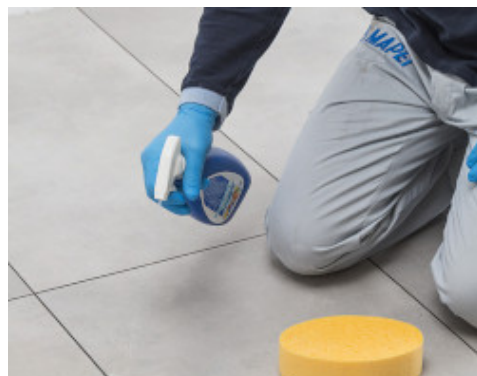
Abschließende Reinigung mit Kerapoxy Cleaner