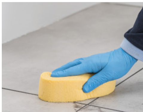
Entfernung von Rückständen von Flexcolor 4 LVT mit einem Schwamm von der Fliesenoberfläche