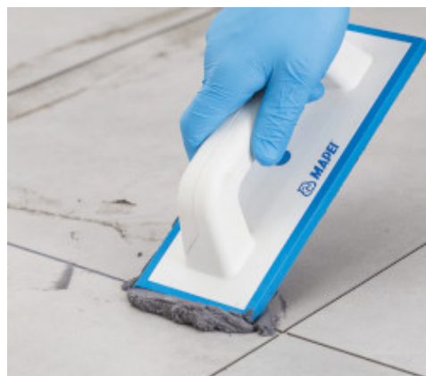
Verfugen mit Flexcolor 4 LVT