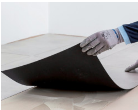
Verklebung von LVT Fliesen mit Ultrabond Eco 4 LVT