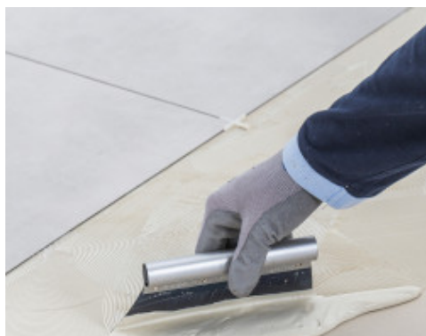
Auftragen von Ultrabond Eco 4 LVT und Verklebung von LVT mit breiten Fugen und Fugenkreuzen

Einen Tag nach dem Verfugen die abschließende Reinigung mit einem trockenen Tuch durchführen. Leichte Schleier von der Oberfläche mit einem Scotch-Brite® Pad abwischen. Falls erforderlich, kann ein flüssiger Reiniger, wie z.B. Kerapoxy Cleaner verwendet werden.