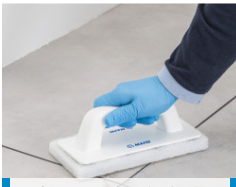
Entfernen von Rückständen des Produktes, die nach einigen Stunden sichtbar sind, mit einem Scotch-Brite® Pad